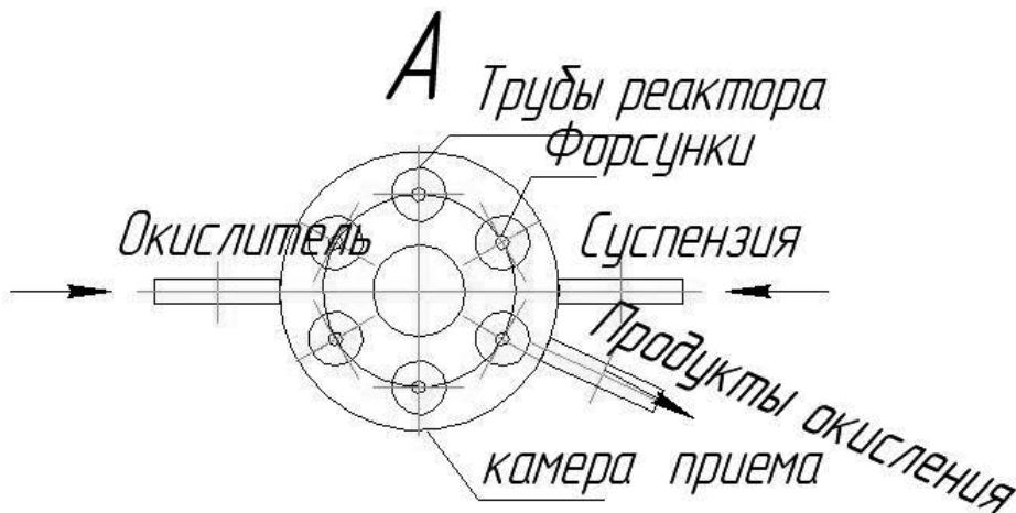
Рис. 1. Многотрубный реактор. Вид сверху

На рис.1 и рис.2 представлен один из вариантов устройства многотрубного реактора (вид сверху (рис.1) и устройство головной части многотрубного реактора (рис.2)).